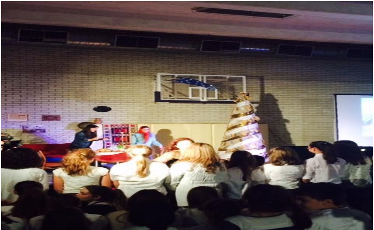
- 2016. január 26. Szent Száva Nap – iskolai ünnepség